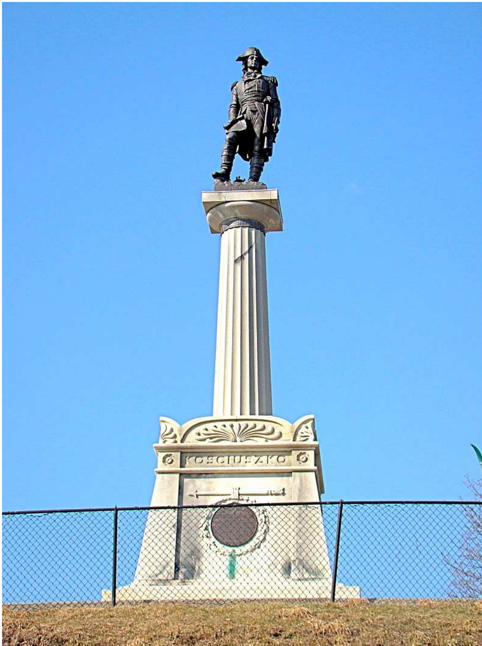
Kościuszko Monument West Point

Tadeusz Kościuszko jest uznawany za bohatera narodowego Polski, Stanów Zjednoczonych Ameryki oraz Białorusi. Imię Kościuszki nosi także park w mieście Milwaukee w stanie Wisconsin oraz Kosciuszko Park w Chicago.