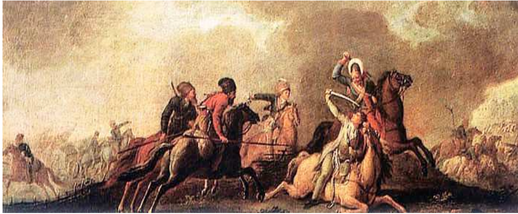
Kościuszko pada ranny pod Maciejowicami