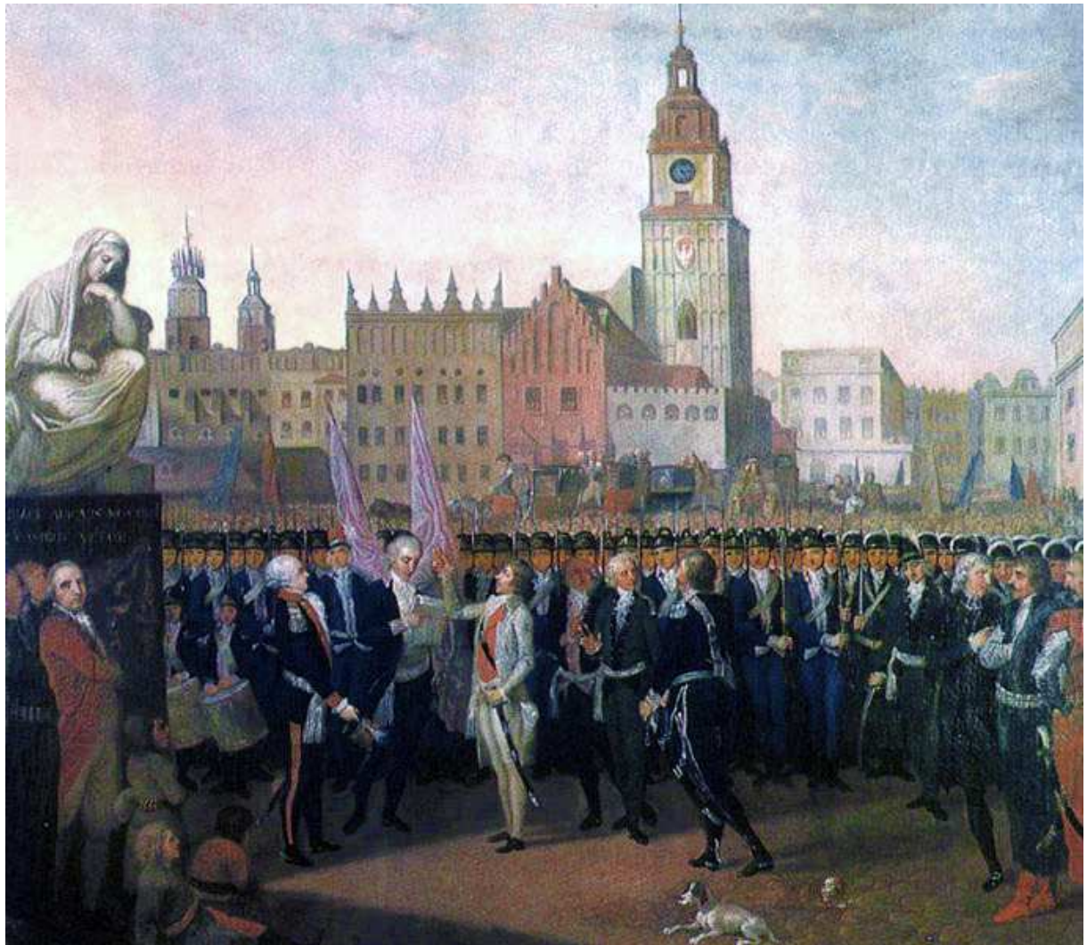
Przysięga Kościuszki na Rynku w Krakowie, 1794 ( obraz Franciszka Smuglewicza),

Tymczasem sytuacja w kraju rozwijała się w niepomysłnym kierunku. Zapadła, wymuszona na Radzie Nieustającej, decyzja o znacznej redukcji wojska polskiego. W pierwszych dniach marca rosyjskie władze okupacyjne wpadły na trop warszawskiej organizacji spiskowej. Kolejni emisariusze z kraju przynosili do Lipska naglące wezwania. W tej sytuacji Kościuszko zdecydował się na rozpoczęcie insurekcji mimo niewykonania jego instrukcji. Prawdopodobnie 15 marca wyruszył z Drezna do Krakowa. 24 marca 1794 na rynku krakowskim złożył narodowi uroczystą przysięgę i objął formalnie przywództwo insurekcji jako Najwyższy Naczelnik Siły Zbrojnej Narodowej.