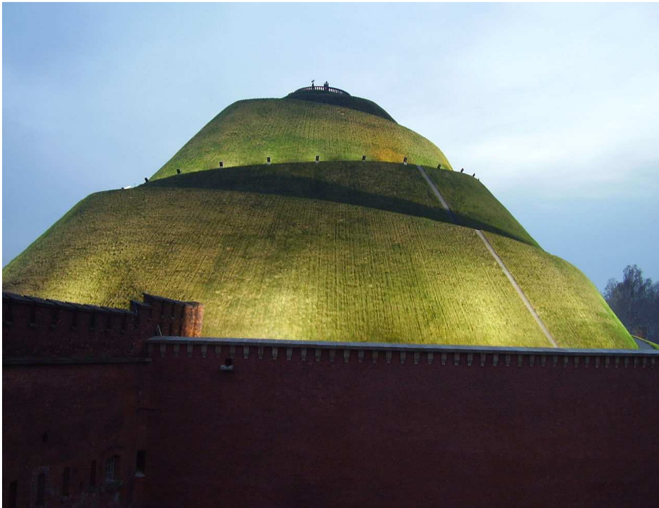
Kopiec Kościuszki w Krakowie